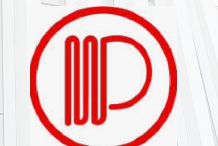
PT PHENOLIC PRIMA MULIA INDONESIA