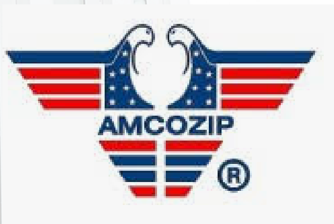
PT FALIMAN ZIPPER