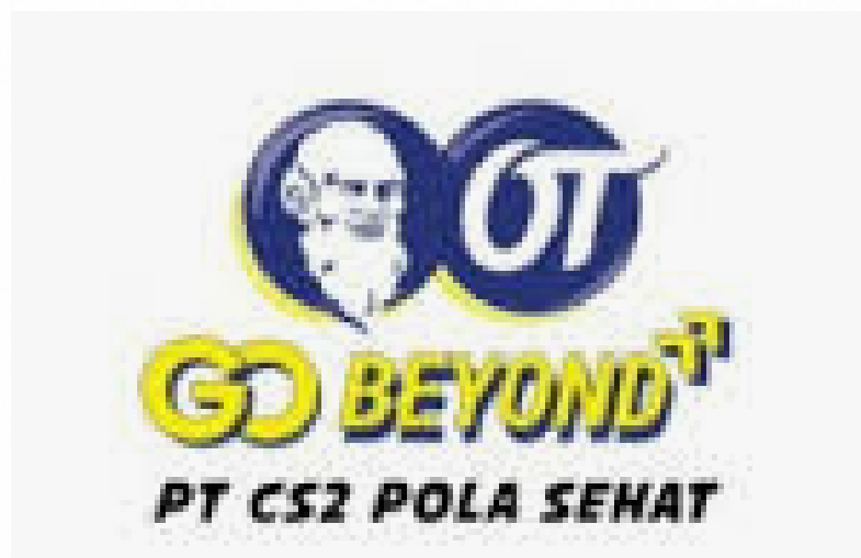
PT CS2 POLA SEHAT (TEH GELAS)