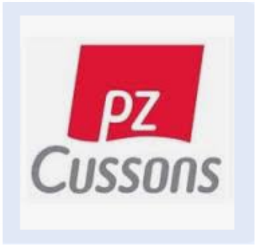
PT PZ CUSSONS