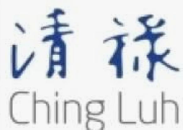
PT CHING LUH INDONESIA